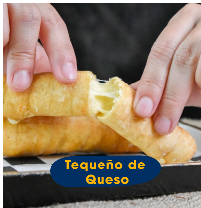
Tequeño de Queso

Combinación grande de queso, plátano maduro y jamón cubierto con una masa fina de harina de trigo